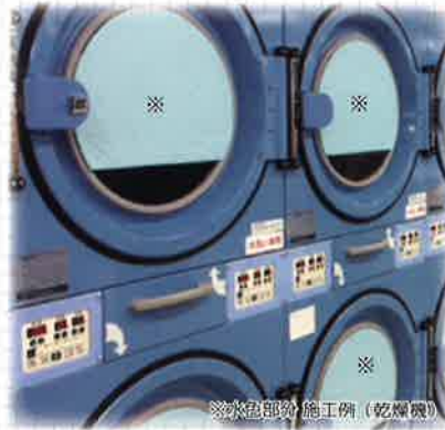
※水色部分 施工例 (乾燥機)